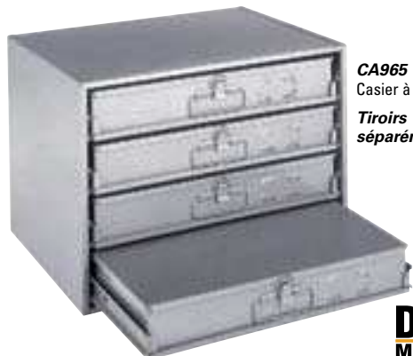
CA965 Casier à tiroirs Tiroirs vendus séparément