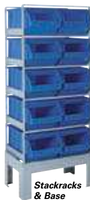
Stackracks & Base Stackrack

Photo montrant un double Stackrack, offert sur demande