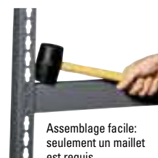
Assemblage facile: seulement un maillet est requis