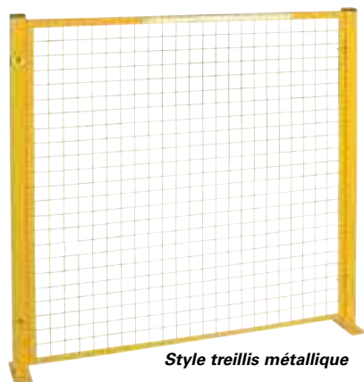
Style treillis métallique